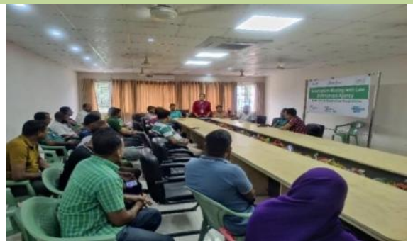
স্থানীয় আইন প্রয়োগকারী সংস্থার সাথে আলোচনা সভা

২০২৩ সালে আমরা এ প্রকল্পের মাধ্যমে স্থানীয় আইন প্রয়োগকারী সংস্থা তথা লোকাল থানার সাথে আলোচনা সভার আয়োজন করেছি। এর মধ্যে রূপনগর থানা, মিরপুর আদর্শ থানা, শাহ আলী থানা এবং দারুস সালাম থানা উল্লেখযোগ্য। এ ধরনের মিটিং আয়োজনের উদ্দেশ্য ছিল হতদরিদ্র পথবাসী, বুপরিবাসী এবং অনুরূপ বস্তিবাসী মানুষদের প্রতি আইন প্রয়োগকারী সংস্থার সদস্যদের ইতিবাচক দৃষ্টিভঙ্গি তৈরী করা। সভায় আমরা প্রকল্পের কার্যক্রম সম্পর্কে অবগত করেছি, আমাদের সুবিধাভোগীরা যাতে অহেতুক হয়রানীর শিকার না হয় তার জন্য পুলিশ সহ অন্যান্য আইন প্রয়োগকারী কর্মকর্তা-কর্মচারীদের আন্তরিক সহযোগিতা কামনা করেছি।