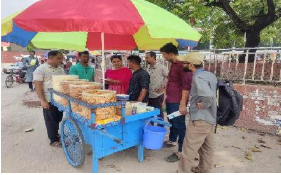
মনিটরিং এবং ফলোআপ কার্যক্রম

সুবিধাভোগীদের ব্যবসা শুরু করার পর থেকে তাদেরকে নিয়মিত ফলোআপ করা হয়েছে। প্রশিক্ষনে যে বিষয়গুলো আলোচনা করা হয়েছে তা সঠিকভাবে বাস্তবায়িত হচ্ছে কিনা তা দেখার জন্য স্টাফরা নিয়মিত বেনিফিসিয়ারিদের নিকট গিয়েছে এবং তারা কোন সমস্যায় পরলে তা সমাধানের জন্য সহযোগিতা করা হয়েছে। যাতে করে তাঁর ব্যবসা সে সঠিকভাবে পরিচালনা করতে পারে এবং ধাপে ধাপে সুবিধাভোগীরা গ্র্যাজুয়েট হতে পারে সে দিকে লক্ষ্য রেখে ফলোআপ কৌশল প্রণয়ন করা হয়েছে। সুপারভাইজার, মনিটরিং অফিসার এবং ফিল্ড অপারেশন ম্যানেজারের সমন্বয়ে তাদেরকে নিয়মিত ফলোআপ করা হয়েছে। নিয়মিত ফলোআপের ফলে সুবিধাভোগীরা স্টাফদেরকে সহযোগী বন্ধু হিসাবে গ্রহণ করেছেন এবং তাদের কর্মস্পৃহা পর্যায়ক্রমে বৃদ্ধি পেয়েছে। নগর হতদরিদ্র মানুষেরা তাঁদের লক্ষ্য পূরণের উদ্দেশ্যে যাত্রা শুরু করেছে। এ যাত্রার ১ম বৎসর (২০২৩) অতিবাহিত হলো।