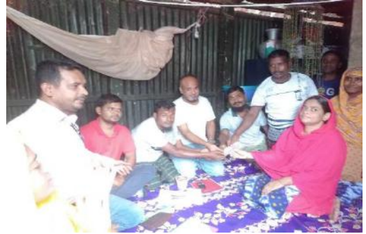
স্বর্ণায়মান সঞ্চয় কার্যক্রম

এ কার্যক্রমটি খুব সুন্দর এবং আকর্ষণীয়। ১২ থেকে ১৫ জন করে সদস্য সম্পৃক্ত করে একেকটি দল তৈরী করা হয়। দলের সদস্যরা সপ্তাহে বা মাসে একত্রিত হয়। সবাই ৫০০/- টাকা বা ১০০০/- টাকা করে জমা দেয় এরপর সবার নাম লিখে একটি পাত্রের মধ্যে রাখা হয়। লটারীর মাধ্যমে ড্র করে সব টাকা একজনকে দেয়া হয় পরবর্তী মাসে আরেক জন তার পরের মাসে আরেকজন এভাবে রোটেশন করা হয়। যিনি টাকা পেয়ে যান তিনিও রোটেশন শেষ না হওয়া পর্যন্ত টাকা জমা দিতে থাকেন। এভাবে এক রাউন্ড শেষ হলে পরবর্তী রাউন্ড শুরু হয়। প্রাপ্ত টাকা ব্যবসায়ের তহবিল হিসাবে ব্যবহার করা হয়।