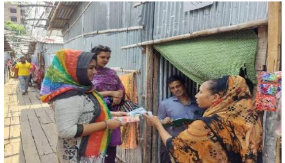
প্রকল্পের জরিপ কার্যক্রম

প্রকল্পের শুরুতেই আমরা আমাদের নির্ধারিত কর্ম এলাকা ঢাকা উত্তর সিটি কর্পোরেশনের আওতায় মিরপুরে জরিপ কাজ সম্পন্ন করি। এখানে উল্লেখ্য যে আমরা পরপর ২টি জরিপ (সার্ভে) করি। একটি সার্ভের মাধ্যমে আমরা কিছু মানদণ্ড বা নির্ণায়ক মেনে দিনে রাতে ঘুরে ঘুরে বেনিফিসিয়ারিজ নির্বাচন করি। নির্বাচনের মাধ্যমে তাঁদেরকে বেনিফিসিয়ারিজ হিসাবে তালিকাভুক্ত করা হয়েছে। আরেকটি বেইজ লাইন সার্ভে করি। বেইজ লাইন সার্ভের মাধ্যমে তাদের বর্তমান আর্থিক ও সামাজিক অবস্থান লিপিবদ্ধ করে রাখা হয়। যাতে পরবর্তীতে তাদের অবস্থার পরিবর্তন অতি সহজেই পরিমাপ করা যায়। সার্ভের মাধ্যমে ২৭৫১ পথবাসী, বুপড়ীবাসী এবং অনুল্লত বস্তিবাসী পরিবার তালিকাভুক্ত করা হয়। কার্যক্রম বাস্তবায়নের সুবিধার্থে ২,৫০০ পরিবারকে ১৭টি ক্লাস্টারে বিভক্ত করা হয়। একেকটি ক্লাস্টারে ১ম বৎসরের জন্য ৬০টি করে পরিবার মোট ১০২০ পরিবার তালিকাভুক্ত করা হয়েছে এবং পরিকল্পনা অনুযায়ী কার্যক্রম বাস্তবায়ন করা হচ্ছে।