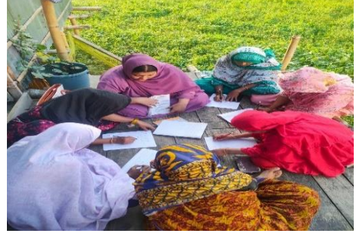
বয়স্ক শিক্ষা কার্যক্রম

এই প্রকল্পের সুবিধাভোগীরা যাতে তাদের ক্ষুদ্র ব্যবসার হিসাব-নিকাশ সঠিক ভাবে রাখতে পারে এবং অল্পস্বল্প লেখাপড়া করতে পারে। তার জন্য প্রতিটি কর্মএলাকায় একজন করে কমিউনিটি ভলান্টিয়ার নিয়োগ দেওয়া হয়েছে। এসএসসি/এইচএসসি পাশ এ সকল নিয়োগপ্রাপ্ত কমিউনিটি ভলান্টিয়াররা যাতে সঠিক পদ্ধতিতে বেনিফিসিয়ারিদের লেখাপড়া শেখাতে পারে তারজন্য একজন বিশেষজ্ঞ প্রশিক্ষকের মাধ্যমে ১০ দিনের একটি প্রশিক্ষণ প্রদান করা হয়েছে। প্রশিক্ষণে প্রাপ্ত জ্ঞান দিয়ে এ সকল কমিউনিটি ভলান্টিয়াররা সঠিক পদ্ধতিতে বেনিফিসিয়ারিদের লেখাপড়া শেখাচ্ছেন।